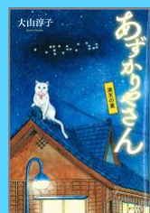
『あすかりやさん[5] 満天の星』 大山淳子 (ポプラ社)