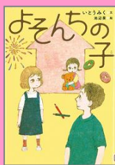
『よそんちの子』 いたうみく (ほるぷ出版)