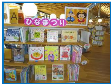
◆ひなまつり (1A 棚)