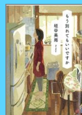
『もう別れてもいいですか』 垣谷美雨 (中央公論新社)