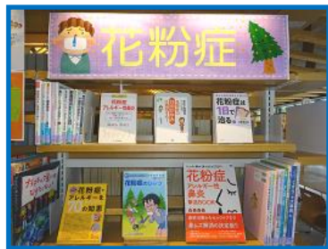
◆花粉症 (7 番棚)