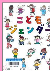
『こどもジェンダー』 シオリヌ (ワニブックス)