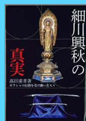
『細川興秋の真実』 高田重孝 (早川書房)