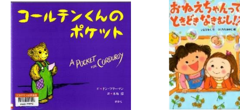
『コールテンくんのポケット』 ドン・フリーマン/作 木坂涼/訳 好学社 『おねえちゃんって、ときどきなきむし!?』 いたうみく/作 つじむらあゆこ/絵 岩崎書店