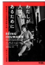
『わたしが人間であるために 障害者の公民権運動を闘った「私たち」の物語』 藤岡 陽子/著 ジュディス・ヒューマン他 現代書館