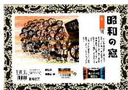
『昭和の窓』しかけ紙芝居 やべみつりのり/脚本・絵 遠山昭雄/監修 雲母書房