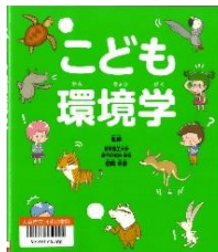
『こども環境学』 朝岡 幸彦/監修 新星出版社