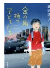
『金の角持つ子どもたち』 藤岡 陽子/著 集英社