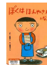
『ぼくはほんやさんになる』 菊池社一/作 塚本やすし/絵 ニコモ