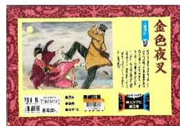
『金色夜叉』 尾崎紅葉/原作 サワジロウ/脚本・絵 遠山昭雄/監修 雲母書房