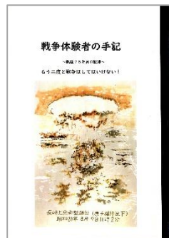
『戦争体験者の手記 戦後75年目の記録』 嶺 和子/語り 上中 万五郎/絵 天草市立図書館/編集 2021.2