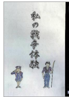
『私の戦争体験 子どものころ戦争があった』 上中 万五郎/語り・絵 天草市立図書館/編集 2022.2