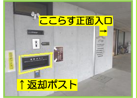
こちらの投函口から本をゆっくり入れてください

【対象館】中央図書館・御所浦図書館 (牛深図書館・河浦図書館につきましては決定次第お知らせします) 【期間】5月16日(月)~23日(月) 返却される場合は返却ポストをご利用ください。 利用者の皆さまにはご不便をおかけしますが、ご理解いただきますようお願いいたします。