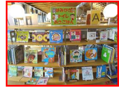
◆はみがき・トイレ・あさごはん (1A棚)