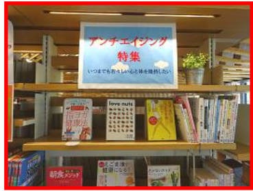
◆アンチエイジング特集 (いろはにホットスペース)