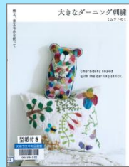
『大きなダーニング刺繍』 ミムラトモミ (誠文堂新光社)