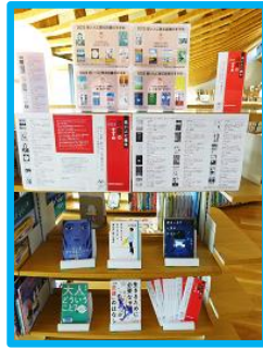
◆若い人に贈る 読書のすすめ 2023 (1A)