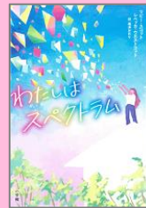
『わたしはスペクトラム』 リビー・スコット (小学館)