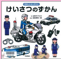
『けいさつのずかん』 山田タクヒロ(絵) (学研プラス)