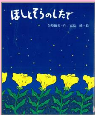
『ほしとそらのしたで』 矢崎節夫 (フレーベル館)