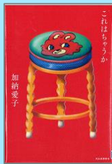
『これはちやうか』 加納愛子 (河出書房新社)