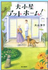
『犬小屋アットホーム!』 大山淳子 (U-NEXT)